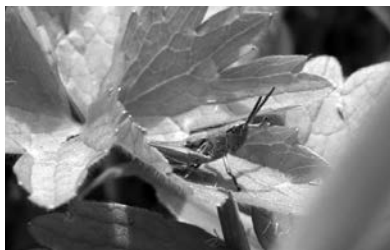
Veldsprinkhaan zwaait met linkerpootje: daaaaag!