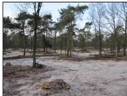
Figuur 2. Kleinschalig en reliëfvolgend heideherstel

Ten behoeve van uitbreiding van het leefgebied voor gladde slang is in de winter van 2012 ongeveer 13 ha naaldbos verwijderd. Vervolgens is 60% van de oppervlakte kleinschalig en reliëfvolgend geplagd (zie figuur 2). De versnipperde heideterreinen op de Eckeltse Bergen zijn dankzij de maatregelen weer met elkaar verbonden, waardoor genueitwisseling tussen populaties kan plaatsvinden. Tenslotte zijn verspreid over de geplagde zones structurelementen en houtstapels in bestaande leefgebieden geplaatst die functioneren als dagschuilplaats en winterslaapplek voor verschillende soorten amfibieën en