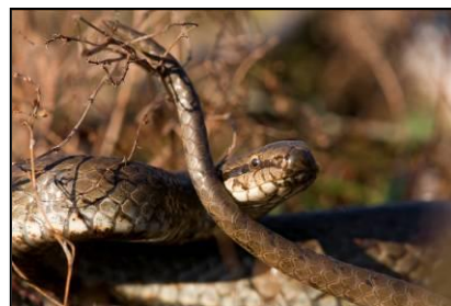
Figuur 1. Gladde slang

De gladde slang komt van oorsprong voor op de hoge zandgronden. Buiten de Veluwe en het Drents-Friese grensgebied heeft een sterke achteruitgang van de soort plaatsgevonden. In Limburg is de gladde slang gebonden aan droge of natte, zandige heide- en (naald)bosgebieden en voormalige hoogveenrestanten. De heidegebieden ten oosten van Nieuw-Bergen, waaronder de Eckeltse Bergen, zijn aan te merken als kernleefgebied. De gladde slang fungeert in plannen voor heideherstel steeds vaker als gidssoort vanwege zijn hoge eisen aan het leefgebied zowel wat betreft kwaliteit als omvang van natuurterreinen.