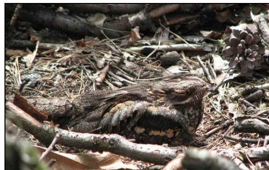
Figuur 1. Nachtzwaluw

Het voorkomen van de nachtzwaluw is in Nederland beperkt tot de hogere zandgronden. Voor Nederland is de staat van instandhouding van de nachtzwaluw bestempeld als matig ongunstig. De soort komt voor in deels dichtgegroeide zandverstuivingen met een niet-vergraste bodem. Daarnaast bevinden nachtzwaluwen zich in halfopen terreinen op schrale, zandige bodems bestaande uit boomheiden, heidevelden met boomgroepen of vliegdenen, kapvlakten en brandvlakten.