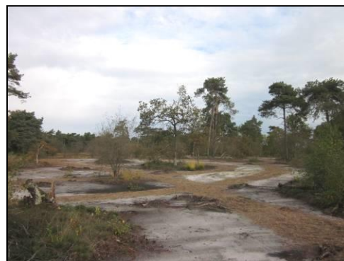
Figuur 2. Maarheezerveld: Kleinschalig plaggen met enkele overstaanders en heidemaaisel

Om het leefgebied voor nachtzwaluw in het Maarheezerveld te optimaliseren zijn in het voorjaar van 2012 door Stichting het Limburgs Landschap maatregelen uitgevoerd. Aansluitend aan het aanwezige heideterrein is naaldbos verwijderd. Hierbij zijn enkele kwarrige eikjes en overstaanders gespaard gebleven. Vervolgens is er kleinschalig geplagd waarna het geheel met heidemaaisel is geënt (zie figuur 2). Door de aansluiting met het nat schraalland in het oosten ontstaat op die flank een heidegradiënt van droog naar nat. Met de maatregelen is het areaal heide ten behoeve van nachtzwaluw met ruim 4 ha uitgebreid. Behalve nachtzwaluw profiteren ook geelgors, boomleeuwerik en roodborsttapuit en reptielensoorten als hazelworm en levendbarende