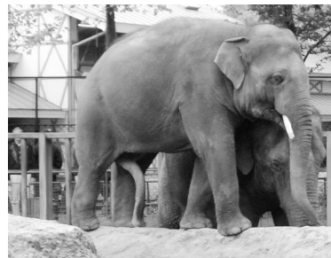
Olifant met piemel (Dionne, 10 jaar)