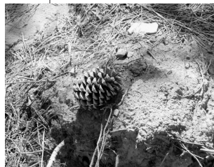
Mooie dennenappel in het bos (Marco, 6 jaar)