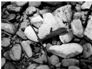
Jesper [7 jr]: 'Mooie kiezels [+ een mier].'