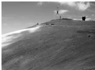
Bram [11 jr]: 'Zand en stenen op de top van de Mont Ventoux.'