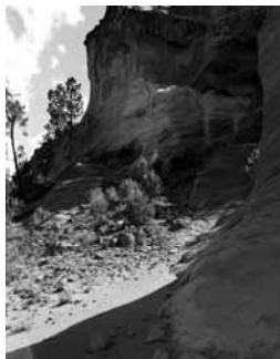
Janneke [9 jr]: 'In Frankrijk zag ik rode rotsen en rood zand!'