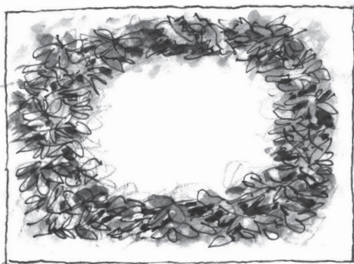
Teken de egel in zijn winternest.

VOORDAT DE WINTERSLAAP begint, moet een egel veel eten. Hij moet dik en vet worden. Help hem met een bordje kattenvoer, meelwormen of pinda's in de dop. Geef geen melk (diarree) maar water. Is hij in winterslaap, dan daalt zijn temperatuur, ademhaling en hartslag. Zijn lijf staat op de spaarstand. Vet zorgt dat hij in leven blijft. Hij valt flink af, want het vet raakt langzaam op. Als hij in april wakker wordt, is hij broodmager. Hij vergaat van de honger. Het eerste wat hij doet: eten zoeken! Ook dan kun je helpen met wat voer.