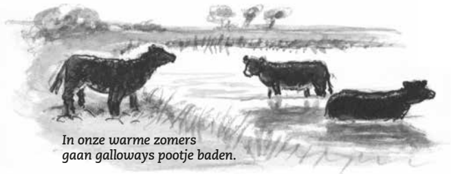
In onze warme zomers gaan galloways pootje baden.

Galloways lopen al zo'n 30 jaar ook in Nederland rond. Je kunt ze tegenkomen in natuurgebieden van Het Limburgs Landschap. Ze hebben weinig zorg nodig en kunnen heel het jaar buiten blijven. Ook in de winter. Onze melkkoe is wat dat betreft een watje.