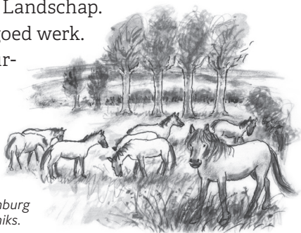
In natuurgebied Ingendaël in Zuid-Limburg graast een kudde koniks.

Het zijn natuurvriendelijke grasmaaiers!